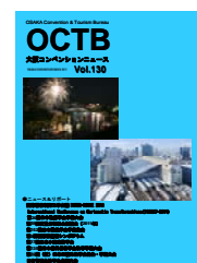
大阪コンベンションニュース